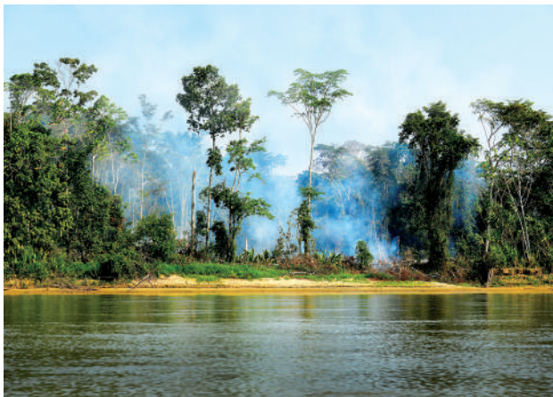
Parque Nacional del Manu