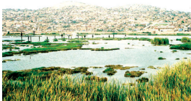
Pantanos de Villa