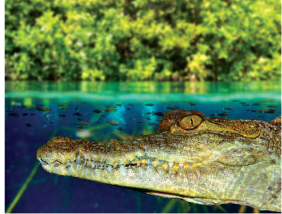
Manglares de Tumbes