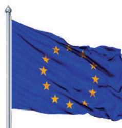
Bandera de la Unión Europea