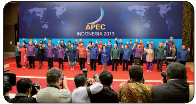
El presidente Humala en el APEC-2013