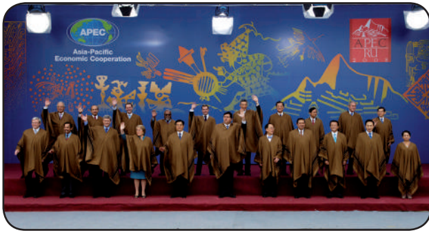
El expresidente Alan García en el APEC-2008 (Lima)