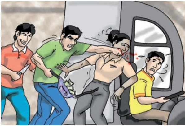
Violencia y asaltos que día a día cobran más vidas inocentes

Cada vez es más común ser testigos de una gran cantidad de asaltos o daños a la integridad física a personas que retiran dinero del banco o de cajeros automáticos. Para evitar todo ello, se recomienda realizar esas transacciones utilizando alguna entidad financiera, ya sea un banco, una financiera, una cooperativa u otros. No debemos arriesgar nuestras vidas y tampoco enfrentar a una cruda realidad que debe ser resuelta antes de que cobre más vidas inocentes.