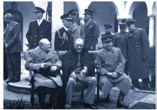
Churchill, Roosevelt y Stalin (Conferencia de Yalta)

Segunda conferencia de los Tres Grandes (Roosevelt, Churchill y Stalin), en la ciudad de Yalta (Ucrania). Se aprobó la decisión de dividir Alemania en zonas de ocupación que serían administradas por una comisión de control central, con sede en Berlín, y se acordó invitar a Francia a hacerse cargo de la administración de una zona de ocupación y participar en la comisión de control. Se comunicó que en el mes de abril tendría lugar en San Francisco una conferencia para la fundación de la Organización de las Naciones Unidas.