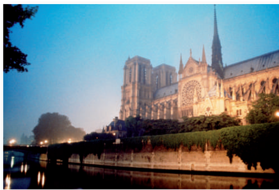
Catedral de Notre Dame

Después de su muerte, acaecida el 22 de mayo de 1885, en París, su cuerpo permaneció expuesto bajo el Arco del Triunfo y fue trasladado, según su deseo, en un mísero coche fúnebre, hasta el Panteón donde fue enterrado junto a algunos de los más célebres ciudadanos franceses.