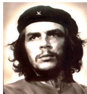
Ernesto Che Guevara

Durante todo el año de 1957, la guerrilla crece y se fortalece, a pesar de las acciones ofensivas del ejército enemigo, para 1958, se convoca a la Huelga General Revolucionaria del 9 de abril, que mal planificada, es sofocada por el gobierno, que, semanas después, convencido de