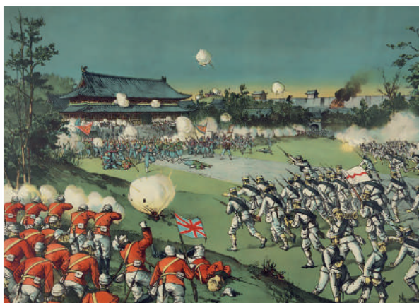
La rebelión de los Bóxers

Proceso de cambio a nivel político, económico y social cuyo objetivo fue desterrar de China el feudalismo, la intervención de las potencias extranjeras y al emergente capitalismo. Se desarrolló en dos etapas: nacionalista y socialista.