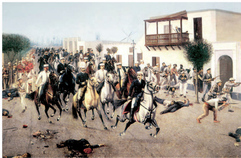
Piérola ingresa a Lima