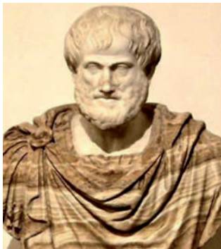
Aristóteles, «Padre de la Psicología»

La palabra psicología proviene de dos voces griegas, psique, que significa «alma o soplo vital» y logos, que significa «estudio, tratado, discurso». Por tanto, puede decirse que la Psicología es el «estudio o tratado del alma». Y se le considera a Aristóteles como el «Padre de la Psicología», ya que fue el primero en escribir un tratado llamado Acerca del alma.