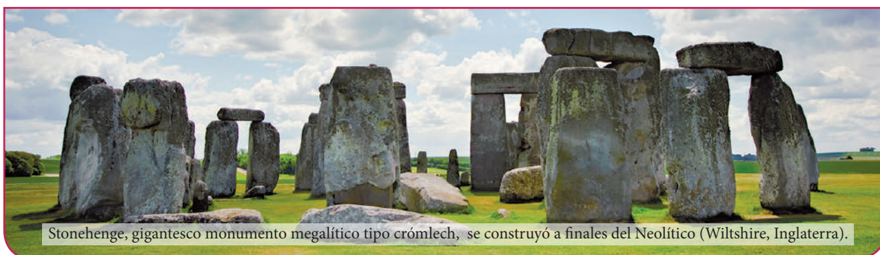
Stonehenge, gigantesco monumento megalítico tipo crómlech, se construyó a finales del Neolítico (Wiltshire, Inglaterra).

En este periodo también son característicos los monumentos menhires, los dólmenes y cromlechs.