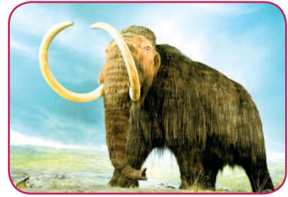
Leyenda: La extinción de los dinosaurios y mamuts marcó el período Mesolítico.