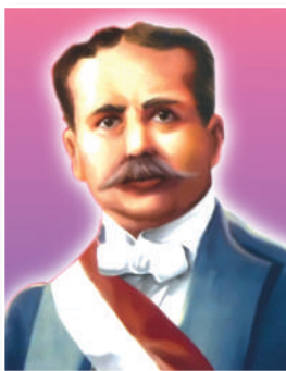
El segundo gobierno de Pardo y Barreda estableció la jornada de ocho horas de trabajo, el pago a los jornaleros así como el trabajo de los indígenas, mujeres y menores.

El segundo gobierno de José Pardo y Barreda significa la vuelta a la normalidad constitucional, con el debido respeto a las funciones de las instituciones, a la ley y las libertades públicas. Estuvo marcado, básicamente, por el desarrollo de la Primera Guerra Mundial y las luchas de los obreros por sus reivindicaciones laborales.