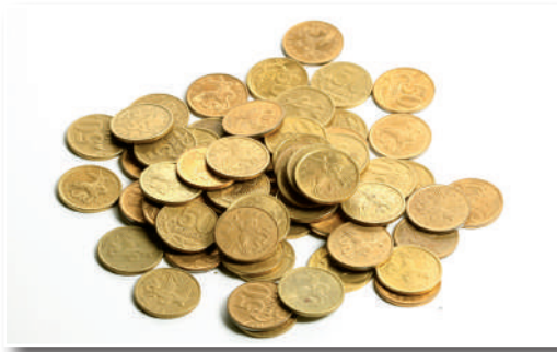
La Primera Guerra Mundial causó graves pérdidas económicas al Estado peruano al punto de desaparecer la libra de oro, reemplazada por billetes.