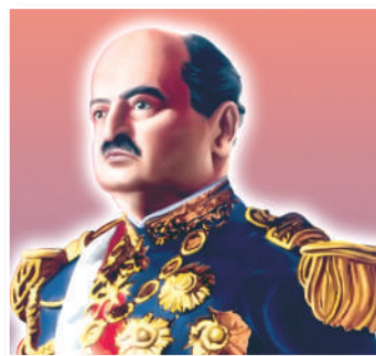
Óscar R. Benavides obligó a la London Pacific, petrolera inglesa, a pagar los impuestos de acuerdo a la verdadera extensión de su explotación en Paita.

❖ Problema de la Brea y Pariñas: según la Legislación de Minas entonces vigente, los que explotaban el petróleo debían pagar al Estado un impuesto de 30 soles oro por pertenencia que explotaran (pertenencia = extensión de 40 000 m 2 ). De acuerdo con la medición hecha por el juez de Paita en 1888, por orden del Gobierno, dichos campos petroleros abarcaban diez pertenencias (empresa británica London and Pacific Petroleum) y fueron inscritos con esa extensión en el Padrón General de Minas, y el impuesto por pertenencia era de 30 soles. Así la London and Pacific estaba obligada a pagar al Estado un impuesto anual de 300 soles por las diez pertenencias. Sin embargo, la Junta de Gobierno ordenó llevar a cabo una remensura, una nueva medición de dicho campo, que reveló la existencia de 41 614 pertenencias en donde el juez de Paita había medido en 1888 solo diez. De esta manera la Junta de Gobierno ordenó a dicha empresa realizar el pago de 1 248 420 soles en vez de 300 que hasta entonces venían abonando.