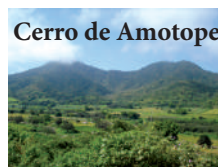
Cerro de Amotape