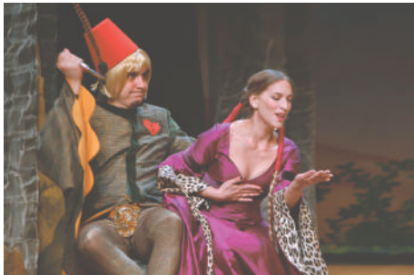
Escena de una obra de teatro en España

La historia del teatro español hasta el Siglo de Oro se remonta al siglo XII. En el periodo comprendido entre los siglos XII y XV, el teatro era casi puramente un teatro religioso e improvisado. A finales del siglo XV, bajo el reinado de los Reyes Católicos, aparece una generación de dramaturgos que forman el teatro real. Crean una forma dramática para dar expresión a sus inquietudes y preocupaciones, persiguiendo una finalidad estética.