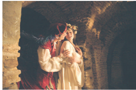
Representación escolar de Tragicomedia de Calisto y Melibea

Otro autor importante de entonces es Fernando de Rojas (1470-1541), quien obtuvo un éxito fulminante con La Celestina . Esta se publicó por primera vez en 1499 como la Comedia de Calisto y Melibea . En 1502 apareció la segunda versión ampliada de la obra que pasaba de constar de 16 a 21 actos y se titulaba Tragicomedia de Calisto y Melibea .