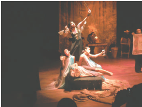
Representación del Égloga de Plácida y Victoriano de Juan del Encina

Destaca Juan del Encina (1468-1529), Patriarca del Teatro Español, como uno de los dramaturgos más conocidos de su tiempo. Su obra se reduce a una serie de églogas (composiciones amorosas entre pastores y en verso).