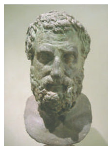
Busto de Esquilo

Después de este grandioso periodo hay épocas que podríamos denominar de enlace, en las que el teatro se desdibuja o se pierde por completo. Desde la decadencia del teatro latino y cuando la sociedad se iba condensando en su proceso de descomposición, lo teatral sufre o se identifica con él. En los albores de la Edad Media, toda la cultura grecorromana encerrada en el tiempo, no puede inyectar vida, y por consecuencia, el teatro, que es ante todo una forma concreta de cualquier estado cultural, también se asfixia y desaparece. Van pasando los años y los siglos; vuelven a afirmarse principios, y los centros cargados de espíritu irradian luz en las sombras de la vida ciudadana. La religión necesita de formas populares para entrar en las conciencias, y es hacia el siglo XI cuando el clero de Occidente recurre al elemento teatral para proporcionar a los contenidos dramáticos de su dogma una divulgación fácil y certera.