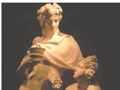
Estatua griega de Dioniso, dios de la fertilidad y la vendimia

La historia del teatro en Occidente tiene sus raíces en Atenas, entre los siglos VI y V a. C. Allí, en un pequeño hoyo de forma cóncava –que los protegía de los fríos vientos del monte Parnaso y del calor del sol matinal–, los atenienses celebraban los ritos en honor a Dioniso; estas primitivas ceremonias rituales irían luego evolucionando hacia el teatro, y constituirían uno de los grandes logros culturales de los griegos. Lo cierto es que este nuevo arte estuvo tan estrechamente asociado con la civilización griega, que cada una de las ciudades y colonias más importantes contó con un teatro, cuya calidad edilicia era una señal de la importancia del poblado.