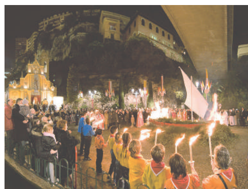
Representación teatral en el atrio de la catedral de Mónaco

Después de este grandioso periodo hay épocas que podríamos denominar de enlace, en las que el teatro se desdibuja o se pierde por completo. Desde la decadencia del teatro latino y cuando la sociedad se iba condensando en su proceso de descomposición, lo teatral sufre o se identifica con él. En los albores de la Edad Media, toda la cultura grecorromana encerrada en el tiempo, no puede inyectar vida, y por consecuencia, el teatro, que es ante todo una forma concreta de cualquier estado cultural, también se asfixia y desaparece. Van pasando los años y los siglos; vuelven a afirmarse principios, y los centros cargados de espíritu irradian luz en las sombras de la vida ciudadana. La religión necesita de formas populares para entrar en las conciencias, y es hacia el siglo XI cuando el clero de Occidente recurre al elemento teatral para proporcionar a los contenidos dramáticos de su dogma una divulgación fácil y certera.