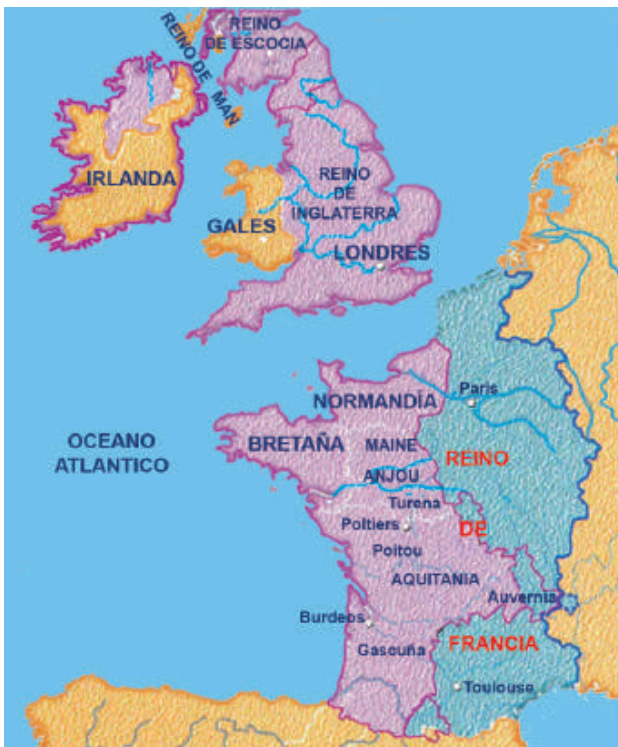
Inglaterra en el s. XII

Marchó a la Tercera Cruzada la cual fracasó, y a su regreso a Inglaterra, es capturado por el emperador del SIRC Enrique VI quien pidió 100 000 marcos por su rescate. Su madre Leonor de Aquitania, luchó incansablemente para obtener la liberación de Ricardo, la cual se logró tras el pago del rescate. Venció sobre el rey de Francia Felipe II y detuvo la ambición de su hermano Juan por arrebatárle el trono. Al atardecer del 25 de marzo de 1199, Ricardo caminaba por el perímetro del castillo Chalus-Chabrol sin su cota de malla, cuando de pronto una flecha lo hirió en el hombro izquierdo cerca del cuello. Días después, fallecía tras reconocer a su hermano Juan como heredero.