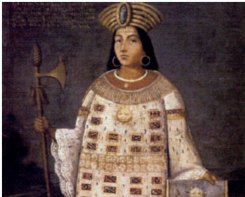
Túpac Amaru I, el último inca de Vilcabamba

El virrey Toledo aprovechando la incursión de franciscanos a Vilcabamba, organizó un ejército dirigido por Martín Hurtado de Arbierto. No encontraron al inca pues el soberano huyó de la zona, pero finalmente el capitán Loyola será el responsable de su captura.