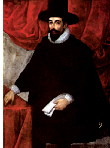
El virrey Toledo fue el responsable del fin de la resistencia de Vilcabamba.

Su cabeza fue exhibida en un lugar público para amedrentar a la población, sin embargo, tuvieron que retirarla pues en lugar de convertirse en una advertencia, se convirtió en un objeto de veneración a cual le rendían culto.