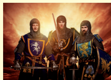
Exalta hechos heroicos