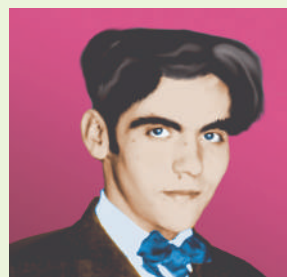
Federico García Lorca. Poeta