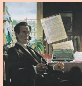
Julio Ramón Ribeyro, autor de La palabra del mudo

La ciudad y los perros de Mario Vargas Llosa ¡Qué viva la música! de Andrés Caicedo