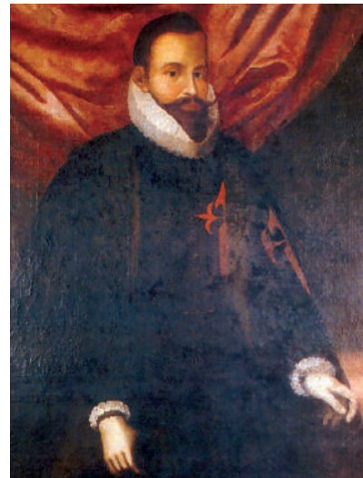
Primer virrey: Blasco Núñez de Vela

La incansable predica de Bartolomé de las Casas en contra de la explotación de los indígenas fue un factor influyente en el establecimiento de las Leyes Nuevas.