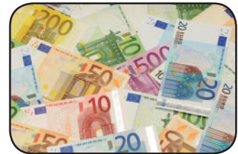
Moneda de la UE

Junto a ellos están: el Tribunal de Justicia de la Unión Europea, el Tribunal de Cuentas y el Banco Central Europeo, el Consejo, la Comisión Europea. A pesar de los avances hechos en política europea de defensa y seguridad, sigue sin existir un ejército puramente europeo. Esto es, una fuerza militar apoyada y financiada por los Estados miembros de la Unión Europea, y que actuaría directamente bajo las directrices de la UE. La principal alianza militar en Europa sigue siendo la OTAN, que incluye 21 de los 28 Estados miembros de la UE, así como otros terceros países europeos, Estados Unidos y Canadá.