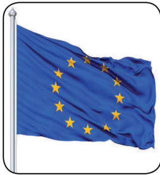
Bandera de la UE

La Unión Europea es una comunidad política de Derecho constituida en régimen de organización internacional para propiciar y acoger la integración de los Estados y los pueblos de Europa. Los veintiocho Estados europeos que la conforman son: Alemania, Austria, Bélgica, Bulgaria, Chipre, República Checa, Croacia, Dinamarca, Eslovaquia, Eslovenia, España, Estonia, Finlandia, Francia, Grecia, Hungría, Irlanda, Italia, Letonia, Lituania, Luxemburgo, Malta, Países Bajos, Polonia, Portugal, Reino Unido, Rumanía y Suecia. Establecida con la entrada en vigor del Tratado Maastricht el 1 de noviembre de 1993, se fundó sobre las tres Comunidades Europeas preexistentes (CECA, Euratom y CEE/CE). La Unión Europea se rige por un sistema interno en régimen de democracia representativa. Sus instituciones son siete: