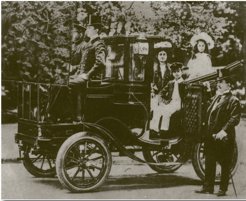
Automóvil siglo XX