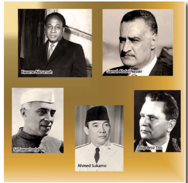
Líderes emblemáticos del Movimiento de Países No Alineados.

dos de las influencias y rivalidades de las grandes potencias o bloques; la lucha contra el imperialismo en todas sus formas y manifestaciones; la lucha contra el colonialismo, el neocolonialismo, el racismo, etc.