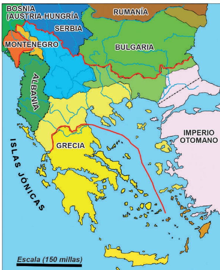
Cambios territoriales tras la Guerras Balcánicas: Tratado de Bucarest (1913)