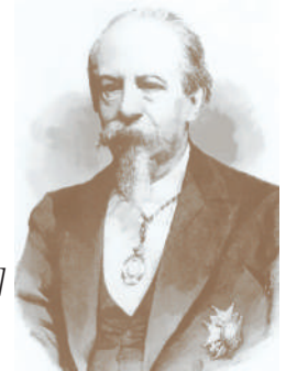
José Zorrilla y Moral

«Abreviemos de razones, Diego Martínez; mi padre, que un hombre ha entrado en su ausencia dentro mi aposento sabe, y así quien mancha mi honra con la suya me la lave; o dadme mano de esposo, o libre de vos dejadme.» Miróla Diego Martínez atentamente un instante, y echando a su lado el embozo repuso palabras tales: «Dentro de un mes, Inés mía, parto a la guerra de Flandes; al año estaré de vuelta y contigo en los altares. [...] «Júralo», exclama la niña. «Dalo por jurado y baste.» «No me basta; que olvidar puedes la palabra en Flandes.» «¡Voto a Dios! ¿Qué más pretendes?» «Que a los pies de aquella imagen lo jures como cristiano del Santo Cristo delante». Vaciló un punto Martínez. Mas porfiando que jurase, llevóle Inés hacia el templo que en medio de la Vega yace. Enclavado en un madero, en duro y postrero trance, ceñida la sien de espigas, descolorido el semblante, veíase allí un crucifijo teñido de negra sangre a quien Toledo devota acude hoy en sus azares. Ante sus plantas divinas llegaron ambos amantes, y haciendo Inés que Martínez los sagrados pies tocase, preguntóle «Diego, ¿juras a tu vuelta desposarme?» Contestó el mozo: «¡Sí juro!», y ambos del templo se salen. [...]