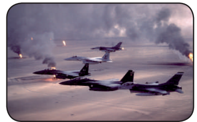
Tormenta sobre Kuwait

Unas 150 000 tropas iraquíes, en gran mayoría veteranos de la guerra Irán-Irak, rápidamente superaron a las fuerzas kuwaitíes ubicadas en la frontera, que no sumaban más de 20 000.