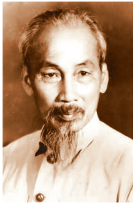
Ho Chi Minh

En un principio, la guerra tiene el carácter de una guerra colonial. Francia, ante la mirada distante u hostil de las dos grandes superpotencias (EE.UU y la URSS) trata de restablecer el control sobre Indochina, para ello concede al antiguo emperador Bao Dai la independencia de un Vietnam, pero que quedaría integrado en la Unión Francesa. La guerra, sin embargo, entra de lleno en el marco de la Guerra Fría tras la victoria comunista en China en 1949 y la Guerra de Corea. Apoyados por los chinos, el Vietminh (Liga para la independencia de Vietnam) se convierte en un moderno ejército comandado