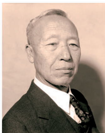
Syngman Rhee, de tendencia anticomunista, fue el primer presidente de Corea del Sur.