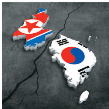
Corea del Sur y Corea del Norte quedaron separadas en dos estados independientes en 1945.