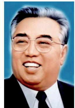
Kim Il-sung se autoproclamó presidente de Corea del Norte, país al que gobernó autoritariamente.

MacArthur fue relevado del mando por el presidente Truman en 1951. Las razones de esta decisión fueron muchas y bien documentadas. Entre estas estaba la reunión que tuvo MacArthur con el presidente de la República de China (Taiwán) Chiang Kai-shek haciendo el papel de diplomático de Estados Unidos. MacArthur también se equivocó en Guam cuando el presidente Truman le preguntó específicamente sobre el refuerzo de las tropas chinas estacionadas cerca de la frontera con Corea. Además, MacArthur demandó abiertamente un ataque nuclear sobre China. También era rudo y frívolo cuando hablaba con Truman. MacArthur fue reemplazado por el general Matthew Ridgway.