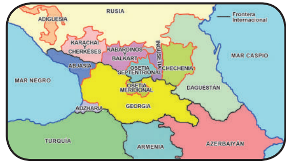
Mapa de Chechenia

La guerra comenzó el 26 de agosto de 1999, cuando el primer ministro ruso Vladimir Putin ordenó al ejército ocupar las zonas fronterizas para impedir nuevas incursiones chechenas contra Daguestán, mientras