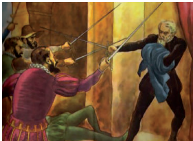
Ataque de los almagristas al conquistador Francisco Pizarro

El 26 de junio de 1541, un grupo de almagristas, encabezado por Diego de Almagro, el Mozo y Juan de Rada, irrumpió en la Plaza Mayor de Lima al grito de ¡Viva el rey, muera el tirano!. Francisco Pizarro fue sorprendido en su propia residencia, y luego de un duro enfrentamiento cayó muerto de una estocada en la garganta. Junto a él murió su hermano Martín de Alcántara.