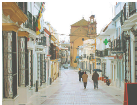
Vista de la ciudad de Moguer.

Además escribió: La soledad sonora , Poemas mágicos y dolientes , Libros de amor , El corazón en la mano , entre otros.