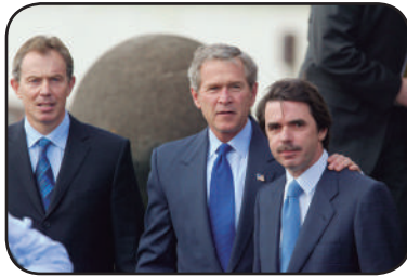
Blair, Bush y Aznar. Cumbre de Las Azoras

En la importante resolución 1441 aprobada en la sesión celebrada el 8 de noviembre de 2002, el Consejo de Seguridad de la ONU decidió requerir a Irak la realización de las inspecciones orde-