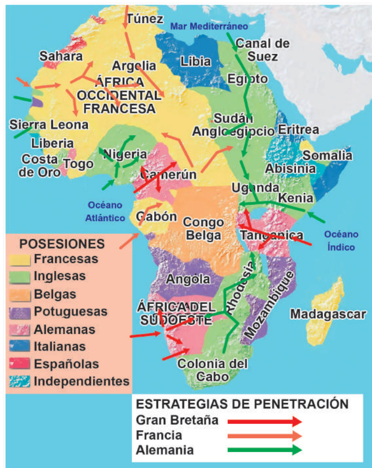
Mapa del reparto de África