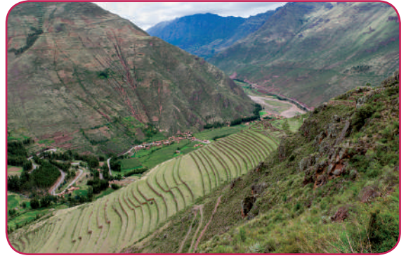
Leyenda: Los andenes de Pisac (Cusco) son una maravilla de la ingeniería inca aplicada a la agricultura.

Un ejército organizado para mantener la supremacía en las provincias. Una lengua imperial (el runasimi) como vehículo de comunicación en el Tahuantinsuyo, llegando a establecerlo como idioma oficial. Una red de caminos (Capac Ñan) que comprendían aproximadamente de 30000 a 50000 km en total y que aseguraba el flujo de las comunicaciones. Contabilidad y registro estatal a través de los quipus (sistema de nudos y cuerdas, a veces de colores, en donde se registraban cantidades y hechos, sólo quedan alrededor de 1000 muestras en total en el Perú y el mundo) que eran manipulados por los quipucamayoc.