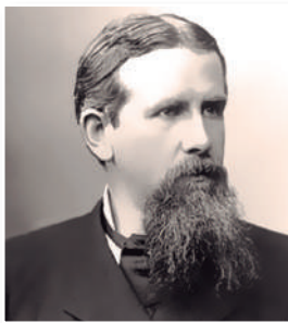
Friedrich Ratzel Siete leyes del crecimiento de los Estados.