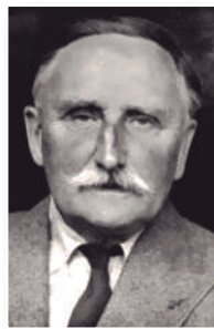
Karl Haushofer Aplicó las teorías de Mackinder. Nuevo orden de Alemania.