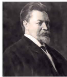
Rudolf Kjellen: Inventó el término geopolítica