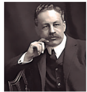
Halford Mackinder: El Estado como un organismo vivo.