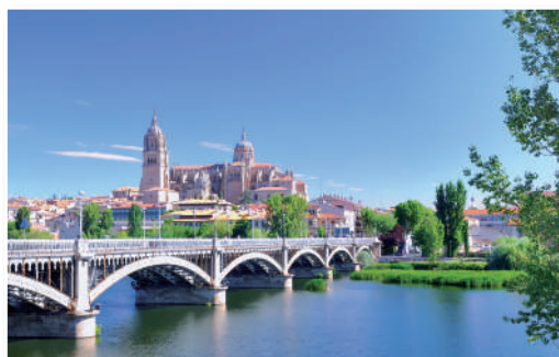
Universidad de Salamanca

Lázaro, antihéroe por excelencia, nos proporciona datos sobre su vida: nació junto al río Tormes, en Salamanca, y es hijo de un molinero y de una viuda amancebada con un negro. Por la obra desfilan los diversos amos a los que ha servido y de los cuales se ha aprovechado invariablemente: el mendigo ciego y ruín, el cura avaro, el escudero deseoso de aparentar, el fraile de la Merced, el buldero (un clérigo dedicado al lucrativo negocio de vender bulas papales), el capellán o el alguacil. El protagonista de la novela vivirá una sucesión de experiencias que irán paulatinamente socavando su integridad moral, en un proceso educativo subvertido. Finalmente, Lázaro obtendrá el oficio real de pregonero en Toledo y nos cuenta cómo un arcipreste le propone el matrimonio con su criada, que además es también su amante. Desde esa situación actual vergonzante, Lázaro confiesa su caso a esa «vuesa merced» que aparece ya en el prólogo.