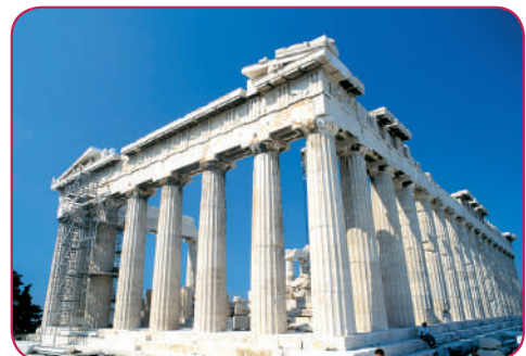
Leyenda: Academia Nacional de Atenas, con estatuas de los filósofos Sócrates y Platón.