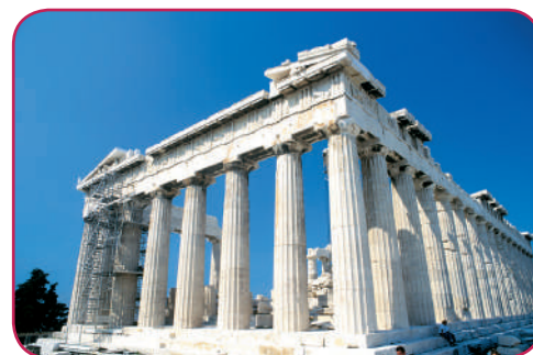
El Partenón es una magnífica muestra del dominio griego de la geometría y las matemáticas.

Son los descendientes de los Dorios, sociedad militarizada, gobernada por la Aristocracia y ubicados en la región de Laconia o Lacedemonia (Península del Peloponeso). Dedicados a la agricultura, rinden culto al dios Ares, su protector. Considerado su reformador político: Licurgo.