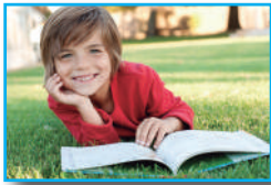
Manuel leerá una libro.