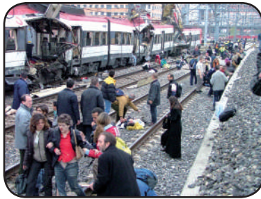
Atentados del 11-M del 2004 en Madrid

El islam es algo más que una religión para sus fieles. Es una receta para la vida, dictando las normas sociales, además de derecho civil y penal. La existencia de Israel es visto como una invasión de la influencia «corrupta» del mundo occidental. Para los musulmanes fundamentalistas, Occidente, liderado por los Estados Unidos, se caracteriza por la desigualdad y la explotación del capitalismo, una filosofía centrada en el individuo. El is-