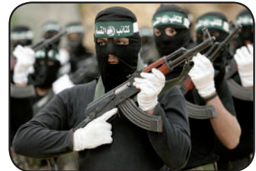
Terroristas yihadistas de Al Qaeda