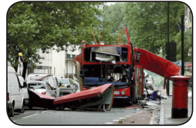
Atentados del 7 julio de 2005, Londres

lam, por su parte, se basa en una filosofía más igualitaria y centrada en la gente. Pero la razón principal por la que los musulmanes se oponen a la influencia occidental, se refiere