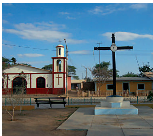
San Miguel de Tangará. Primera ciudad española en territorio andino

Pizarro durante su tercer viaje, fundó la primera ciudad española en territorio del Tahuantinsuyo: San Miguel de Tangará (15 de julio de 1532), en la actual región de Piura.