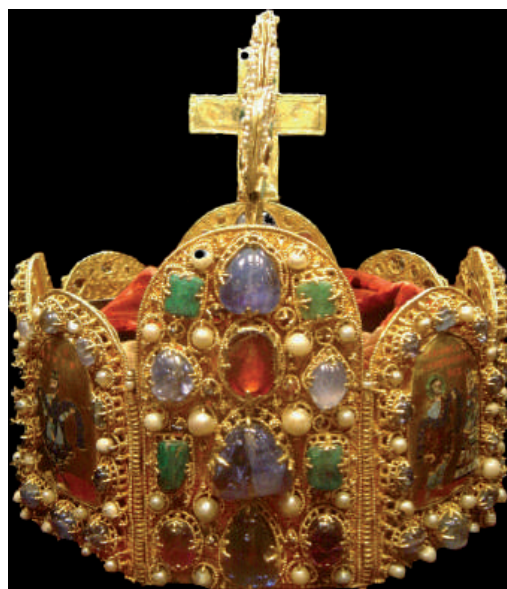
Corona imperial del SIRG

A la muerte de su padre solo tenía tres años. Fue coronado como Otón III en Aquisgrán. Su madre Theofania tomó la regencia y la mantuvo hasta su muerte en el 991, pero tenía dificultad de afirmarse como regente, a causa de las sospechas y de los obispos del imperio que alegaban: “una mujer como regente; es más, una griega” a eso se suma la antipatía de su suegra Adelaida. Murió joven, a los 35 años, el 15 de Junio del 991, por lo que la regencia pasó a la emperatriz Adelaida, que por fin había conseguido su propósito.