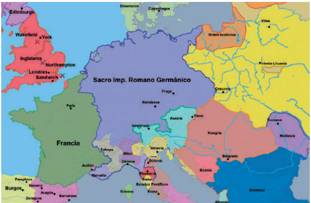
Sacro Imperio Romano Germánico

También conocido como el Primer Reich o Imperio antiguo, fue una agrupación política ubicada en la Europa occidental y central, cuyo ámbito de poder recayó en el emperador romano germánico desde la Edad Media hasta inicios de la Edad Contemporánea. El proceso de formación del Sacro Imperio Romano Germánico está asociado con la política de centralización en la región. Otón I fue electo emperador en el año 936 y durante su reinado comandó los ejércitos que derrotaron a los húngaros, garantizándose así prestigio y gran influencia en su relación con los nobles alemanes y con la Iglesia Católica, a la cual defendía, después de que fuera nombrado sagrado emperador por el Papa, en el año 962. Es así como nació el Sacro Imperio Romano Germánico.