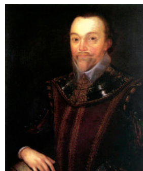
Corsario inglés Francis Drake

Las potencias europeas rivales de España, como Inglaterra, Holanda, Francia buscaron romper el sistema monopólico español, con el propósito de tener acceso a los mercados coloniales americanos y de este modo colocar sus manufacturas. En este contexto, éstas buscaron mecanismos que apunten a ello, siendo los principales el contrabando y los corsarios: