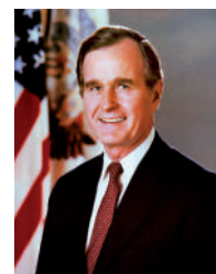
George W. Bush

El 1 de diciembre de 1991, el 90,3% de los ucranianos votaron por la independencia. El 8 de ese mes, en una solución improvisada sobre la marcha, los líderes de Rusia, Ucrania y Bielorrusia acordaron abandonar la URSS y formaban una así llamada Confederación de Estados Independientes. El