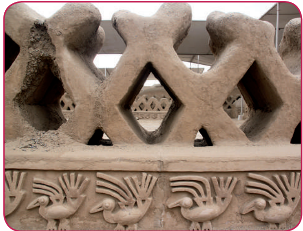
Leyenda: El complejo arqueológico de Chan Chan (Trujillo, La Libertad) es la ciudad de barro más grande de América precolombina.

Realizaron una intensa actividad comercial mediante el trueque entre agricultores y artesanos, inventando la “moneda signo”, que tenía la forma de pequeñas hachas de cobre, las mismas que han sido encontradas en Guayaquil, Tumbes y Chincha.