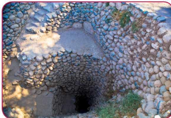
Leyenda: La cultura Nasca se desarrolló en pleno desierto y los acueductos fueron una inteligente solución para proveerse de agua.

La cerámica pictórica fue su actividad más destacada, llegaron a utilizar entre 12 y 16 colores así como 280 matices en un ceramio, al que pintaron sin dejar espacios en blanco (horror al vacío) y su decoración fue naturalista y abstracta. De otro lado, en las pampas de Nasca y Palpa, dibujaron los geoglifos o líneas de Nasca, descubiertas en 1927 por Toribio Mejía Xesspe, y cuya mayor estudiosa fue la alemana María Reiche.