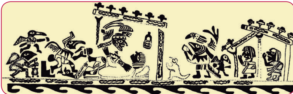
Leyenda: Los mochicas plasmaron sus costumbres en artísticas pinturas y bellos ceramios.