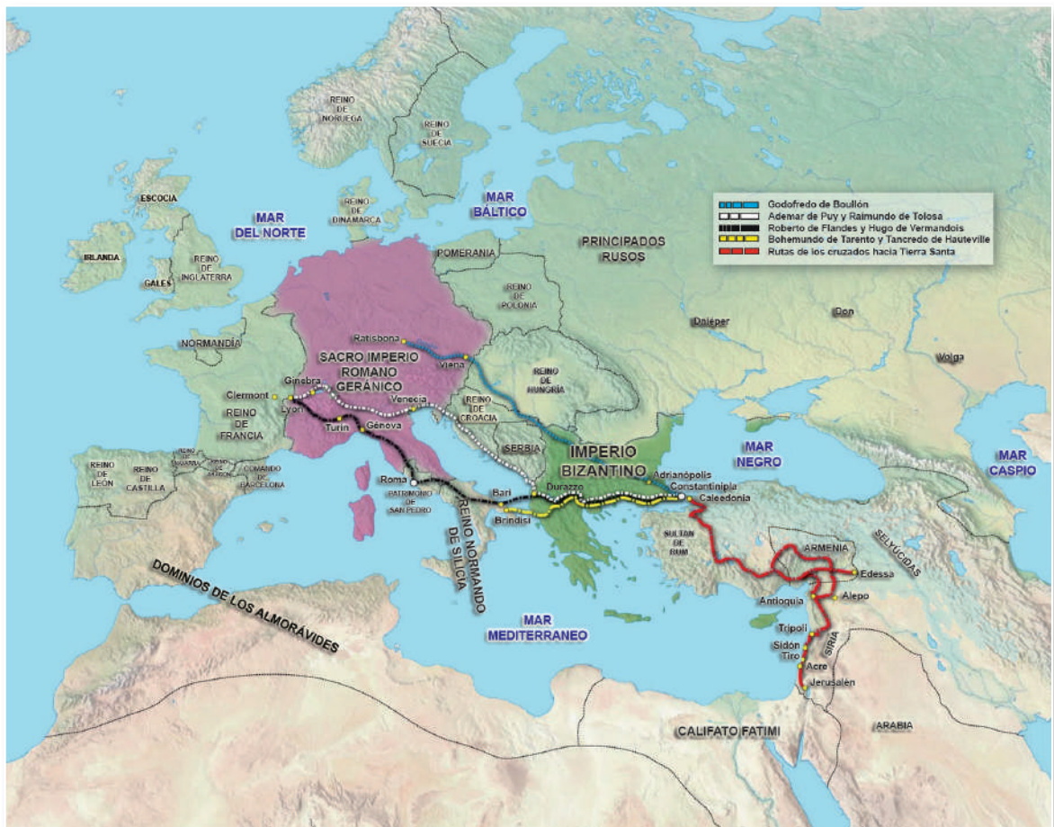
Mapa de la Primera Cruzada

Fue la recuperación de los Santos Lugares.