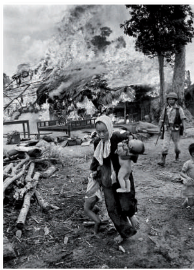
Guerra de Vietnam

Guerra de liberación nacional del pueblo vietnamita que expulsó de su territorio a Francia, Japón y EE.UU.