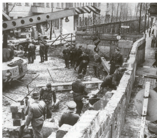
Muro de Berlín

Se estima que, entre 1961 y 1989, al menos 70 personas murieron al intentar cruzar el límite. Ese último año cayó el régimen de la RDA y la demolición del muro comenzó el 9 de noviembre, efectuada tanto por personal oficial como por ciudadanos entusiastas. Su eliminación fue el símbolo del fin de los regímenes comunistas en Europa Oriental.