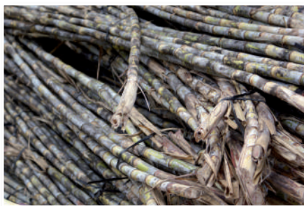
Los llamados “barones del azúcar” predominaron en la clase política de la República Aristocrática (1899-1919).

Fue un periodo dominado casi en su totalidad por el Partido Civil; los gobernantes eran expertos en el manejo económico, sin embargo, miraban con cierto rechazo las costumbres andinas o amazónicas. La cultura andina fue despreciada por los altos círculos limeños en el momento en que se fomentaban las artes y la cultura, pero llegadas de Francia o Inglaterra.