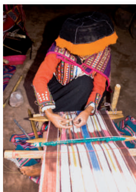
Las culturas andina y amazónica fueron despreciadas por la élite de la República Aristocrática y los campesinos soportaron graves abusos.

Estaba formada por campesinos, artesanos, pequeños comerciantes, vendedores callejeros, obreros de todo tipo. La mayoría de obreros vivían en las zonas urbanas, sobre todo en Lima. El proceso de industrialización también permitió la formación de un grupo compuesto por los obreros de fábricas: el proletariado. En el interior del país estaban los campesinos (indígenas), quienes eran víctimas de explotación y usurpación de tierras. Ello debido a la autonomía que gozaban los hacendados y gamonales, aliados de los grupos de poder.