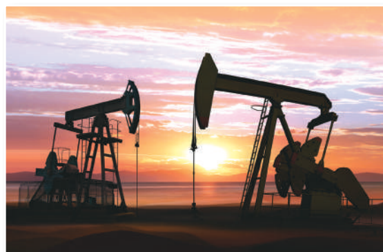
Las ganancias de la explotación petrolera en el norte peruano iban a Inglaterra y Estados Unidos en tanto los campesinos dejaban sus tierras para ser obreros.

En la costa norte, el petróleo, atrajo a las industrias estadounidenses e inglesas. Estos centros mineros se consideran verdaderos «enclaves» que enviaban sus ganancias al extranjero y dejaban poco beneficio en nuestro país. Obtenían su mano de obra mediante el sistema de «enganche», mecanismo por el cual muchos campesinos se convirtieron en obreros.