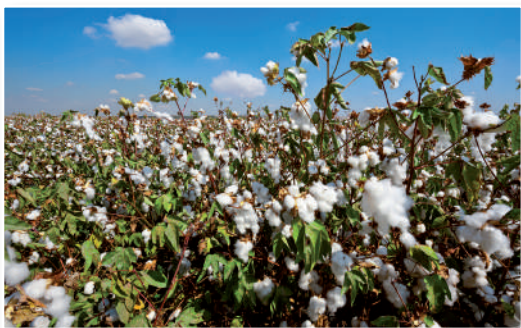
La producción de algodón y de caña de azúcar impulsó el desarrollo de la agroexportación en la costa norte, principalmente.

El auge de la agricultura se dio principalmente en la Costa con la producción de la caña de azúcar y el algodón, en cambio en la Sierra no tenía el mismo impulso. Esta modernización sirvió para tener mayor competitividad en el mercado externo. A diferencia del mercado interno, al cual no se le dio el mismo impulso. En la Sierra, se mantuvo el poder de los hacendados y de los gamonales, ya que, ellos eran los aliados de los gobernantes de la República Aristocrática. En las últimas décadas del siglo XIX y comienzos del XX se produce el llamado boom del caucho en la Selva, a partir del cual la ciudad de Iquitos, que creció de manera importante, se convirtió en un enclave británico.