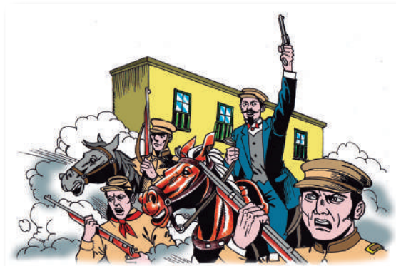
Piérola encabezó la defensa de Lima en la que varones de toda edad lucharon contra los invasores chilenos en las batallas de San Juan y Miraflores.

Ante el saqueo, destrucción y excesos cometidos por los chilenos en Barranco y Chorrillos, el almirante francés Abel du Petit Thouars parlamentó con el general Baquedano para que Lima fuera ocupada pacíficamente. El mando político del Perú fue encargado al general chileno Patricio Lynch.