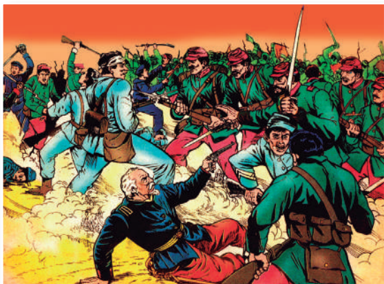
La batalla de Arica es una muestra de patriotismo, dignidad y coraje de los peruanos que combatieron en el morro en desigualdad de condiciones militares.

cho. Los cinco mil soldados chilenos derrotaron a los mil 800 hombres que conformaban la guarnición peruana, pese a la defensa heroica del morro. Así, el Perú fue derrotado en Arica.