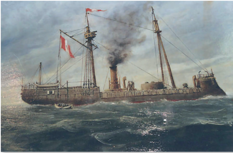
El monitor Huáscar es el símbolo del heroísmo de las fuerzas navales peruanas en la guerra contra Chile.