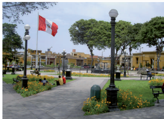
En la plaza Bolívar del actual distrito de Pueblo Libre, se ubicó el gobierno provisional de García Calderón.

Una junta de notables, con el aval de Chile, elige como nuevo presidente a Francisco García Calderón en el pueblo de La Magdalena (reconocido como zona neutral. Hoy es el distrito limeño de Pueblo Libre). Chile buscó negociar la paz con el nuevo Gobierno, para lo cual exigió la anexión territorial de Tarapacá, pero García Calderón mantuvo la postura de un acuerdo de paz sin cesión territorial. Finalmente, García Calderón fue llevado, junto a su familia, a Valparaíso. Luego, se delegó el Gobierno a Lizardo Montero, quien lo encabezó desde Arequipa, mientras que desde Tarma, dimitió, el 28 de noviembre de 1881, el dictador Nicolás de Piérola.