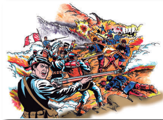
Pese a que la batalla de Tarapacá representó una victoria para el Perú; pero por falta de provisiones las fuerzas peruanas no avanzaron hasta Arica.

Fue una victoria peruana. Destacaron entre las fuerzas peruanas Andrés A. Cáceres, Bolognesi, Alfonso Ugarte, Belisario Suárez, entre otros. Los mandos peruanos, al enterarse que los chilenos se dirigen al cerro, ganan las alturas obteniendo pertrechos militares y armas. Así, los chilenos