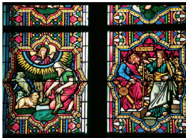
Vitrail de Colonia, Alemania

Para el siglo XV, ya con la pintura flamenca se difunde la técnica del óleo, que permite un estudio minucioso de lo representado, penetrando en el ambiente que retrata, destacando el estudio de la luz y las sombras. El arte gótico es de carácter urbano, arte naturalista y realista.