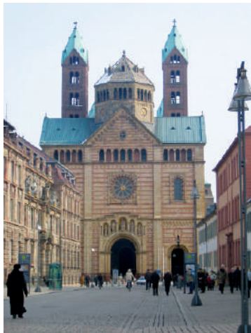
Iglesia de Spira

La imagen es la representación simbólica de una idea, como el Cristo con cuatro clavos, rígido y con los ojos abiertos; o la Virgen en Majestad, sirviendo de trono al Niño y sin comunicación con Él.