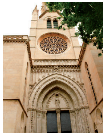
Iglesia de gótica

Estilo artístico que se desarrolló en Europa occidental durante los últimos siglos de la Edad Media, desde mediados del siglo XII hasta la implantación del Renacimiento (siglo XV para Italia), y bien entrado el siglo XVI en los lugares donde el Gótico pervivió más tiempo. Se trata de un amplio periodo artístico, que surge en el norte de Francia y se expande por todo Occidente. Según los países y las regiones se desarrolla en momentos cronológicos diversos, ofreciendo en su amplio desarrollo diferenciaciones profundas: más puro en Francia, más horizontal y cercano a la tradición clásica en Italia.